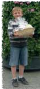
Winnaars wandeling & kinderparcours Pajotternijen