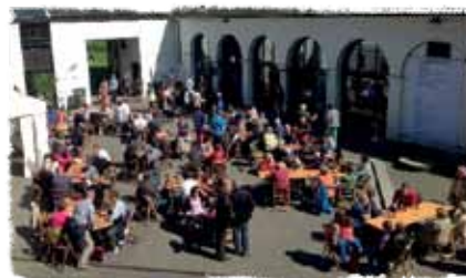
Pajotternijen en week van de amateurkunsten