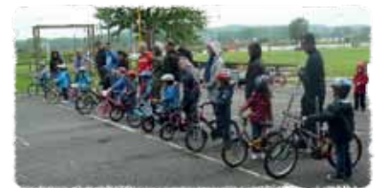
Kijk! Ik fiets!